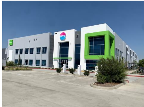
【ミューチャルトレーディング社 本社外観】